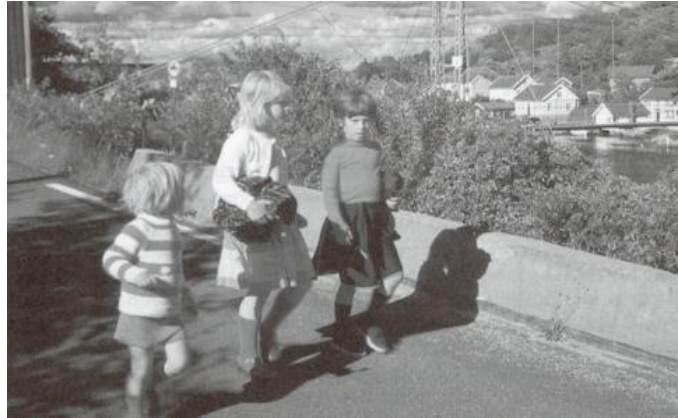
Fra Skjernøy utenfor Mandal, SW 1978